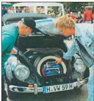
Hebmüller-Schönheit mit ganz speziellen inneren Werten: Für der original Knarrenkasten müssen Liebhaber an die 1000 Euro hinblättern.

Von Michael Ende (Quelle: Cellesche Zeitung)