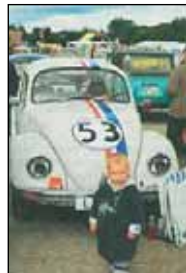
Darf nicht fehlen: „Herbie“

Türgriffe oder nur Nippes „zum Ranschrauben“ suchte. Hier zeigte sich auch, wie kostspielig das Käfer-Hobby für Puristen werden kann: Ein seltener Knarrenkasten, der ins Reserverad passt – dafür muss man schon einmal 1000 Euro hinblättern. Da ist es schon beruhigend, dass der Kasten kein Muss ist: Wer an seinem VW-Oldie schrauben will, braucht weniger teures Werkzeug als vielmehr Enthusiasmus.